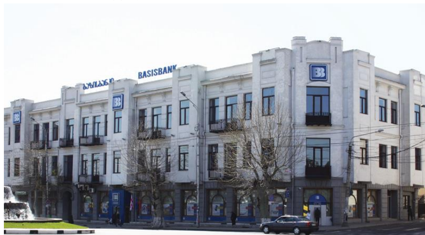
新疆华凌集团收购的基础银行

2018年6月底，格鲁吉亚中央银行公布的拉里兑美元中间价是2.4516拉里，兑欧元是2.8537拉里。2012年新疆华凌集团收购Basis Bank，在该银行网点可办理人民币与拉里直接兑换和转账业务。目前，人民币与拉里尚未实现直接结算，Basis Bank、Bank of Georgia和TBC Bank等主要银行网点可办理人民币兑拉里业务。