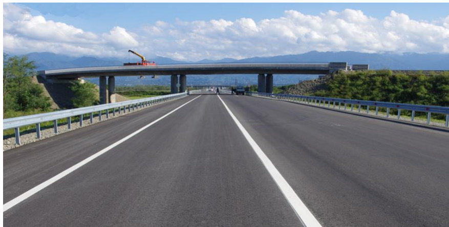
中水电十六局承建的KOBULETI绕城公路项目