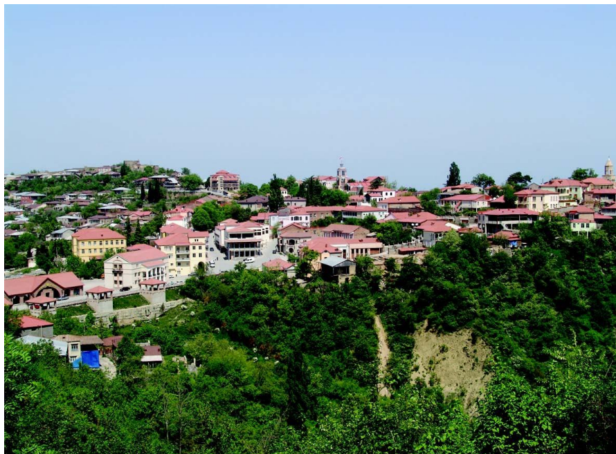
格鲁吉亚小镇——锡格纳基