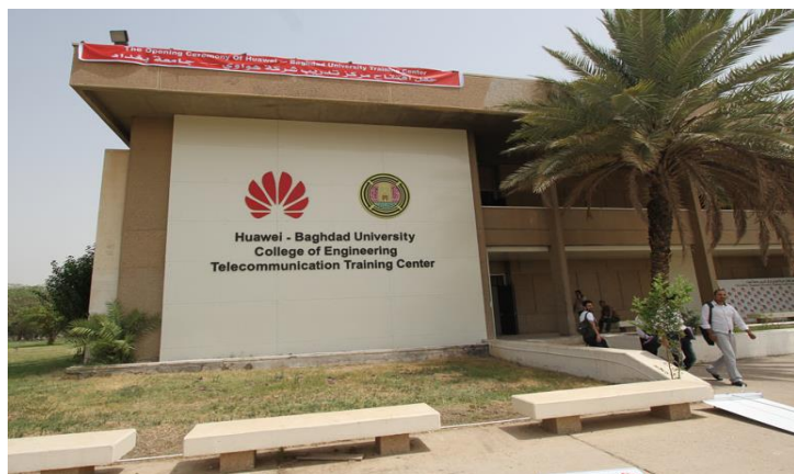
华为-巴格达大学电信培训中心

伊拉克移动用户发展非常迅速，现有的GSM运营商是：ASIACELL、ZAIN、KORAK及部分地方运营商，用户总数约 3480 万。中国华为技术有限公司和中兴通讯有限公司在伊拉克设有分公司。