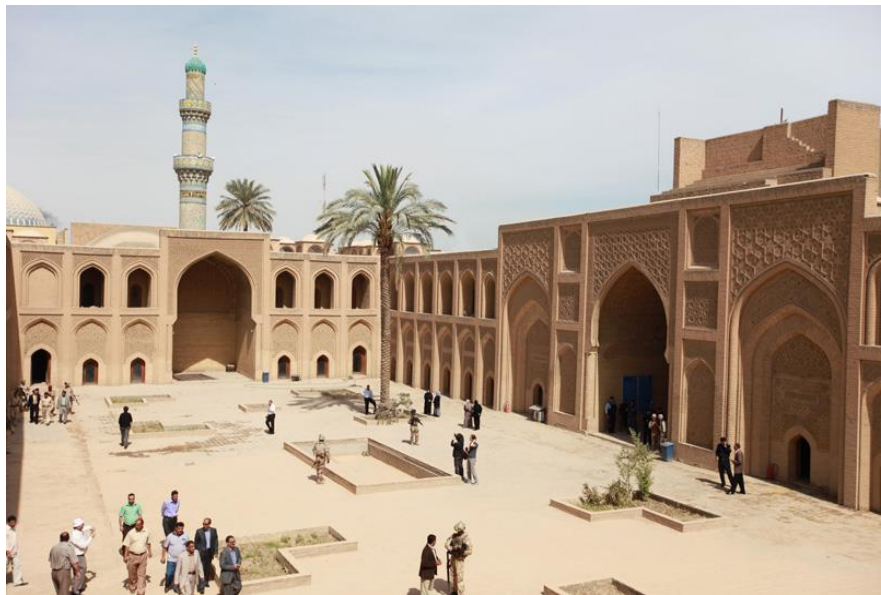
巴格达穆斯坦西里亚大学

【文化】悠久的历史造就了伊拉克灿烂的文化。如今，伊拉克境内古迹遍布，底格里斯河沿岸的塞琉西亚、尼尼微、亚述等均是伊拉克著名的古城。位于巴格达西南90公里的幼发拉底河右岸的巴比伦是与古代中国、印度和埃及齐名的人类文明发祥地，盛传的“空中花园”被列为世界七大奇迹之一。已有1000多年历史的伊拉克首都巴格达更是其辉煌文化的缩影。早在公元8世纪至13世纪，巴格达就成为西亚和阿拉伯世界的政治经济中心和文人、学士荟萃之地。